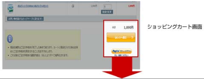
ショッピングカート画面