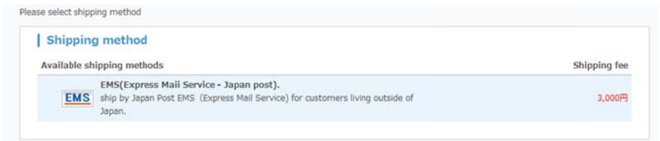
EMS国際スピード郵便プラグインをインストールすれば海外の配送先でも送料計算が可能

Live Commerce ストアで配布される EMS 国際スピード郵便プラグインをインストールすれば、海外の配送先でも送料を自動計算してくれます。