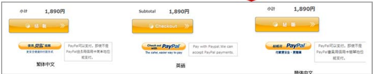
各言語に応じてPayPalのボタンが変わる